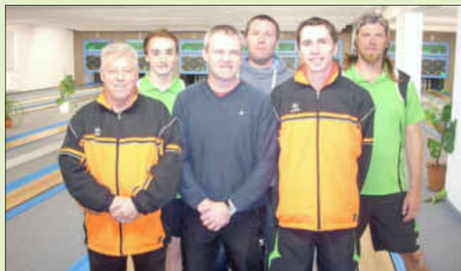
Strahlende Gesichter nach letztem 8. Turniertag bei den Goldberger Keglern.