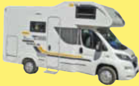
Sun Living A35 SP

Schon an den Urlaub gedacht? Die hier können Sie mieten!