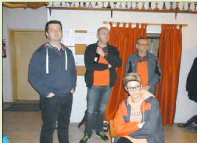
Spieler des Teams von der Sparkasse.