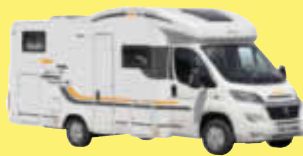
Sun Living M46SP