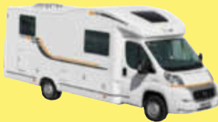
Sun Living M 50 SL