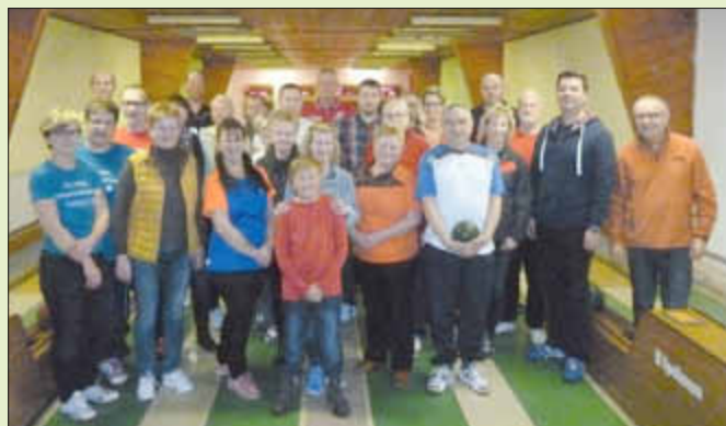
Betriebs- und Stadtmeisterschaften.