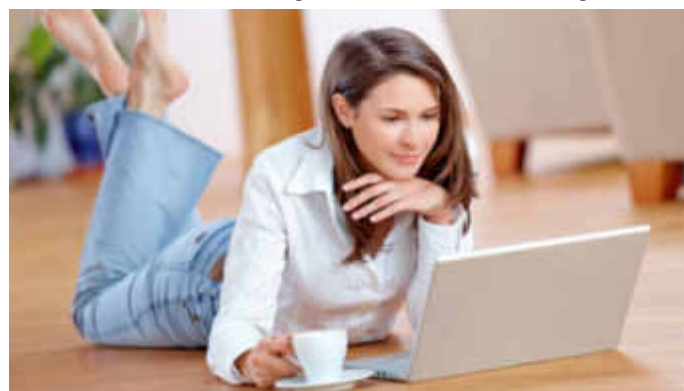
Wenn es um Kredite geht, überzeugen Direktbanken mit günstigen Konditionen, zuverlässigem Service und guter Beratung.

(djd). Viele Bankkunden nutzen den Dispositions-kredit, kurz Dispo, ihres Girokontos. Das erweitert zwar den finanziellen Spielraum und ist bequem, aber meist teuer. Bis zu 14 Prozent Dispozins zahlen Kunden aktuell - das sind, gemessen an den aktuell niedrigen Marktzinsen, stolze Preise. Die Stiftung Warentest („Finanztest“, Heft 3/2014) bezeichnet den Dispokredit sogar als den teuersten Kredit, den Banken anbieten. Deshalb rät sie, diesen nur ausnahmsweise und für kurze Zeit in Anspruch zu nehmen. Wer eine größere Summe für einen längeren Zeitraum wünscht, dem empfehlen die unabhängigen Tester einen deutlich günstigeren Ratenkredit oder einen Abruflkredit. Mehr Informationen zu Ratenkrediten gibt es etwa unter www.volkswagenbank.de .