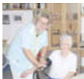
In guten Händen

BETREUTE WOHN- GEMEINSCHAFT im SENIORENLANDSITZ