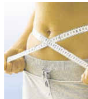
Qualität made in Germany. CE 0197

Fast jeder kennt es: der ärgste Feind jeder Diät oder Abnehmkur ist ganz eindeutig der Hunger! Wie viele Diäten haben Sie schon abgebrochen, weil der Magen knurrt und man schlechte Laune bekommt?