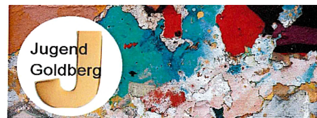
Jugendclub, Parkstrasse 14, 19399 Goldberg / Jugendclub Mestlin, Marx-Engels-Platz 5, 19374

Jugendclub Goldberg ab 10 Jahre Montag: 14:00 Uhr - 18:00 Uhr „Offener Club“ 15:00 Uhr - 18:00 Uhr Clubkochen Donnerstag: 14:00 Uhr - 18:00 Uhr „Offener Club“