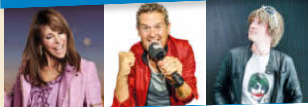
Ireen Sheer, Peter Wackel und Mickie Krause