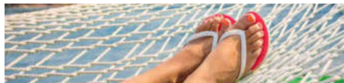
Lässige Flipflops gehören zu den Lieblingsschuhen des Sommers. Damit sie zur Geltung kommen, sind gepflegte Füße wichtig.

(djd). Frauen und Schuhe - das ist eine große Liebe. Kaum eine kann schicken Sommermodellen wie zarten Riemchenpumps, Glitzer-Sandalen oder lässigen Flipflops widerstehen. Doch die schönen neuen Schuhe haben gepflegte Füße verdient. Das beginnt mit einem Fußbad samt wohltuenden Zusätzen, Hornhautentfernung und Nagelkürzung. Dabei sollte man auch auf unschöne Veränderungen der Nägel achten, wie gelbliche Verfärbungen, Verdickungen oder brüchige Stellen. Diese können auf eine Pilzinfektion hinweisen. Unter www.excilor.de findet man einen Selbsttest. Eine klinisch geprüfte Behandlung bei Nagelpilz bietet etwa das Medizinprodukt Excilor auf Essigsäurebasis, damit schnell gesunde Nagelsubstanz nachwächst.