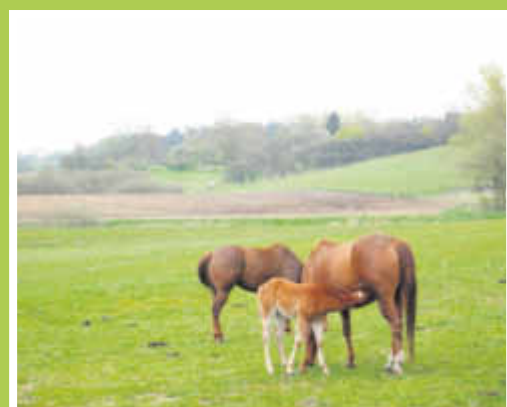
Eindrücke vom Thomashof