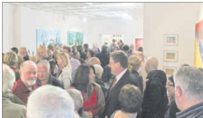
126 Gäste feierten am 5. April die erste Ausstellungseröffnung in der Galerie des Vereins Goldbergkunst e. V.