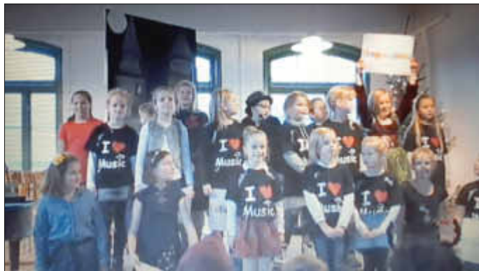
Während der Weihnachtsgala stimmten uns die Chorkinder mit besinnlichen und auch schwungvollen Liedern auf den 1. Advent ein.

Bei Kaffee und selbstgebackenem Kuchen konnten die Gäste die vorweihnachtliche Stimmung genießen.