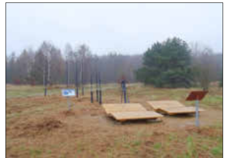
Am Aussichtsturm in Goldberg

den die Besucher bequeme Sitzmöglichkeiten und Erklärungen zum sichtbaren Sternenhimmel. Bei den Erlebnissen in der Nacht geht es weiterhin um nachaktive Tiere wie Eulen, Nachtfalter und Fledermäuse sowie um den Einfluss der Sonnenaktivität auf das Klima.