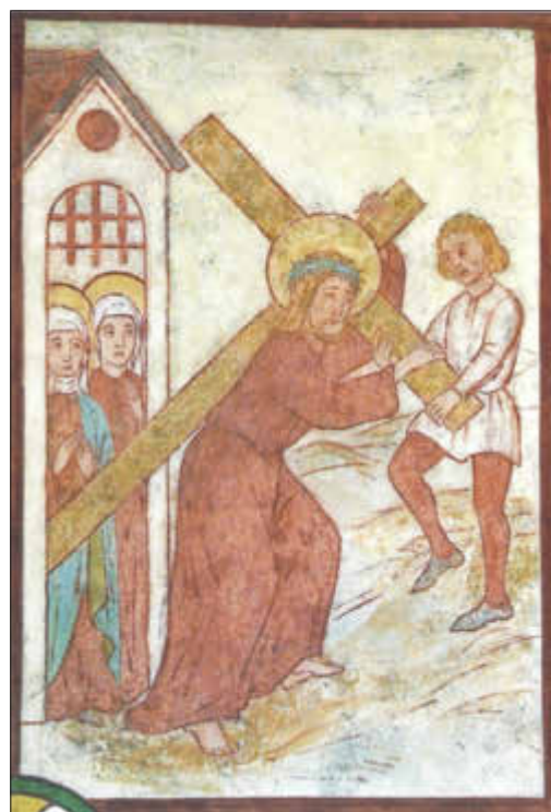
„Kreuztragung“, Kirche Below