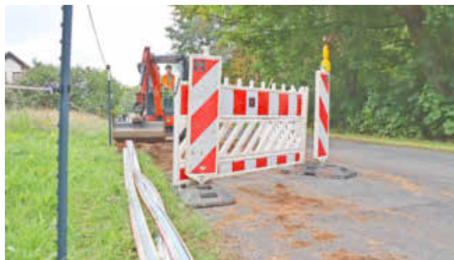
In mehreren Projektgebieten des Landkreises Ludwigslust-Parchim sind im vergangenen Jahr die Bauarbeiten gestartet – so wie hier in Gädebehn.

Insgesamt mehr als 5.000 Kunden surfen im Landkreis Ludwigslust-Parchim bereits mit Lichtgeschwindigkeit im Glasfasernetz. Die Arbeiten am geförderten Glasfasernetz des ersten Förderaufrufs sind inzwischen größtenteils abgeschlossen. Für das Vertrauen und stellenweise auch für die Geduld der angeschalteten Gemeinden