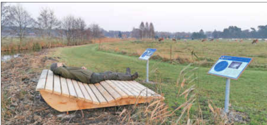
Am Rothirsch in Sandhof