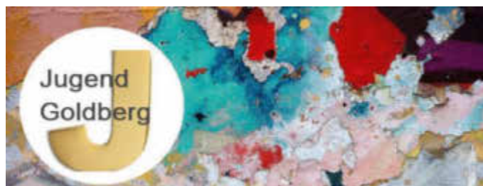
Jugendclub, Parkstraße 14, 19399 Goldberg / Jugendclub Mestlin, Marx-Engels-Platz 5, 19374