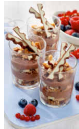
Leckerer Schoko-Schichtpudding mit kinder Schokolade

(djd). Für circa 6 Portionen 9 Riegel kinder Schokolade grob hacken. 2 EL Speisestärke, 1 EL Kakaopulver und 1 EL Puderzucker mischen und mit 50 ml Milch verrühren. Die Mischung in 350 ml kochende Milch geben und unter Rühren 1 Minute köcheln lassen. Zwei Drittel der gehackten kinder Schokolade darin schmelzen und den Pudding mit Folie abgedeckt ca. 90 Minuten kalt stellen. Butterkekse im Gefrierbeutel mit dem Nudelholz zerkleinern und mit der übrigen gehackten Schokolade mischen. Kalten Pudding cremig schlagen und abwechselnd mit der Keks-/kinder Schokolade Mischung in Dessertgläser schichten. Je nach Wahl mit halben kinder Schokoladriegeln, Früchten oder Sahne verzieren und gekühlt servieren.