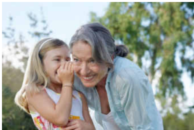
„Oma, die Möhre ist angeknabbert - der Osterhase war da!“