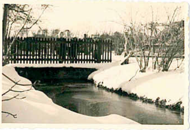
Parkgraben am Heckensteig (1960)