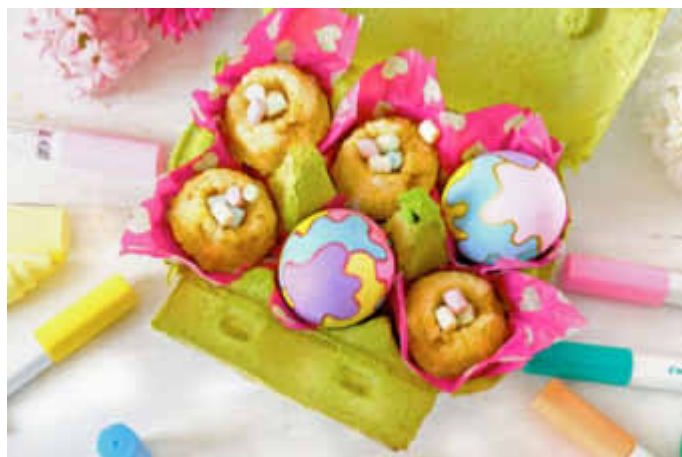
Mit speziellen Kreativmarkern lassen sich Ostereier ganz einfach in 24 Farben gestalten.

Bei der Füllung des Eierkartons sind der Kreativität ebenfalls keine Grenzen gesetzt. Eine Variante: Eier hart kochen und anschließend mit den Kreativmarkern gestalten - zum Beispiel mit bunten Klecksen oder grafischen Mustern. Wer es etwas süßer mag, kann auch kleine Gugelhupfe backen und diese neben die bemalten Eier setzen. Noch eine hübsche Serviette als Einbettung und fertig ist der umgestylte Eierkarton. Weitere kreative Ideen und Anleitungen gibt es auch auf www.pilot-kreativ.de .