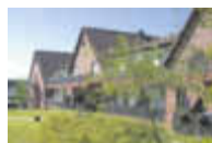
Rundum gut versorgt

BETREUTE WOHN - GEMEINSCHAFT im SENIORENLANDSITZ