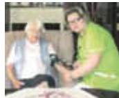
In guten Händen

BETREUTE WOHN - GEMEINSCHAFT im SENIORENLANDSITZ