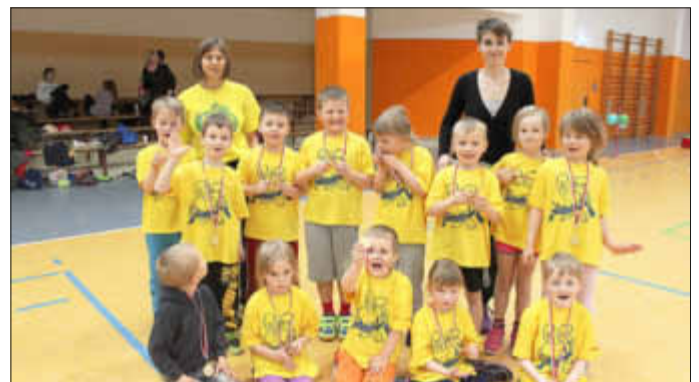
Siegermedaillen für alle - hier die Koboldkinder