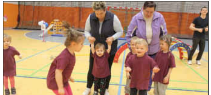
Die Sonnenscheinkinder aus Wendisch Waren in Action