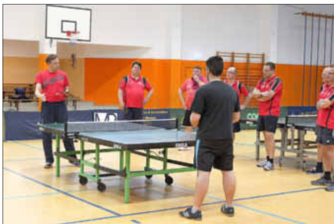
Vorstellung der nächsten Trainingsübung