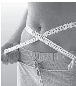
Qualität made in Germany. CE 0197

Fast jeder kennt es: der ärgste Feind jeder Diät oder Abnehmkur ist ganz eindeutig der Hunger! Wie viele Diäten haben Sie schon abgebrochen, weil der Magen knurrt und man schlechte Laune bekommt?