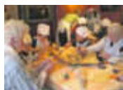
Bewohner so betreuen, wie man es selbst gern hätte