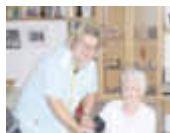
In guten Händen