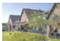
Rundum gut versorgt

Wenn Sie Gefallen gefunden haben und mehr Informationen wünschen, stehen wir Ihnen gern in einem persönlichen Gespräch zur Verfügung.