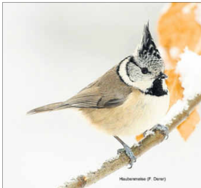
Haubenmeise (F. Derer)