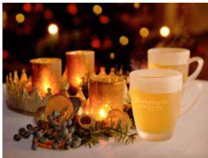
Für sein Wintergetränk hat Schloss Wackerbarth das historische Rezept des Raugrafen von 1834 behutsam an den heutigen Geschmack angepasst.

„Weiß & Heiß“ haben sie das originale Rezept behutsam an den heutigen Geschmack angepasst. Wer den feinfruchtigen Geschmack und die elegante Süße dieses Wintergetränks selbst einmal verkosten möchte, findet dazu zahlreiche Gelegenheiten. Zum Beispiel direkt bei einer der weihnachtlichen Veranstaltungen auf dem Erlebnisweingut in Radebeul oder auf ausgewählten Weihnachtsmärkten im Osten Deutschlands. Man kann das Wintergetränk aber auch im Online-Shop unter www.schloss-wackerbarth.de bestellen und zu Hause genießen.