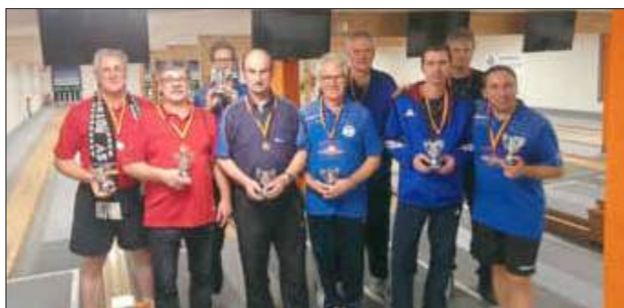
Freudige Stimmung auch bei einem Teil der Erstplatzierten bei den Erwachsenen.