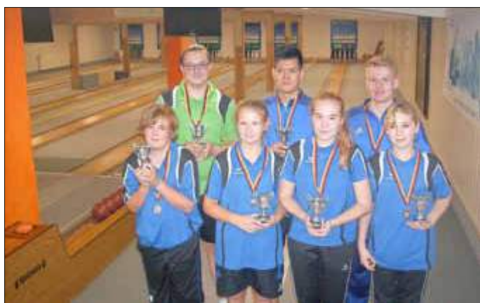
Die sieben Goldberger Medaillengewinner im Jugendbereich präsentieren stolz ihre errungenen Pokale.