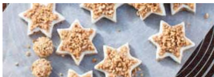
Wie das duftet - Zimtsterne sind ein unverzichtbarer Klassiker!

Die Zubereitungszeit beträgt rund 50 Minuten, die Backzeit circa 2-mal 15 bis 20 Minuten. Pro Stück enthalten die Zimtsterne rund 84 kcal, 1,4 Gramm Eiweiß, 5,3 Gramm Fett, 7,1 Gramm Kohlehydrate und 0,5 Broteinheiten.