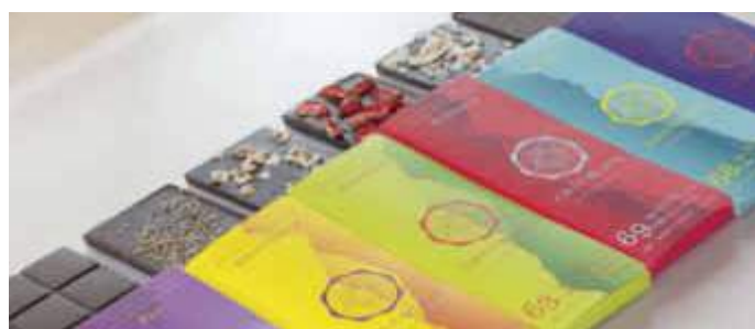
Vielfalt: Beeren, Nüsse, feine Gewürze oder auch Pfeffer verfeinern die Bio-Schokoladen mit naturbelassenen Kakaobohnen.

kein raffinierter Zucker die Schokolade süßt, sondern Kokosblütensüße oder Agavensirup. Zusätzlich sind die edel verpackten Tafeln ein echter Augenschmaus: Zutaten wie Beeren, Nüsse oder auch Hanfsamen werden nicht unter die Kakaomasse gerührt, sondern als Toppings dekorativ über die noch flüssige Schokolade gegeben. Wer zu Weihnachten etwas Besonderes verschenken möchte, hat also die Wahl, ob er selbst zum Chocolatier wird, ein hübsches Set für Schokolade zum Selbermachen verschenkt oder lieber fertige Kreationen unter dem Baum platziert. Gut zu wissen: Ausgefallene Rezeptideen und das nötige Zubehör wie Förmchen bietet der Onlineshop ebenfalls. Und zum Stichwort Nachhaltigkeit: Selbst die stilvollen Verpackungen sind ökologisch durchdacht und kommen ohne Plastik und Klebstoffe daher. Da darf man wirklich mit gutem Gewissen genießen.