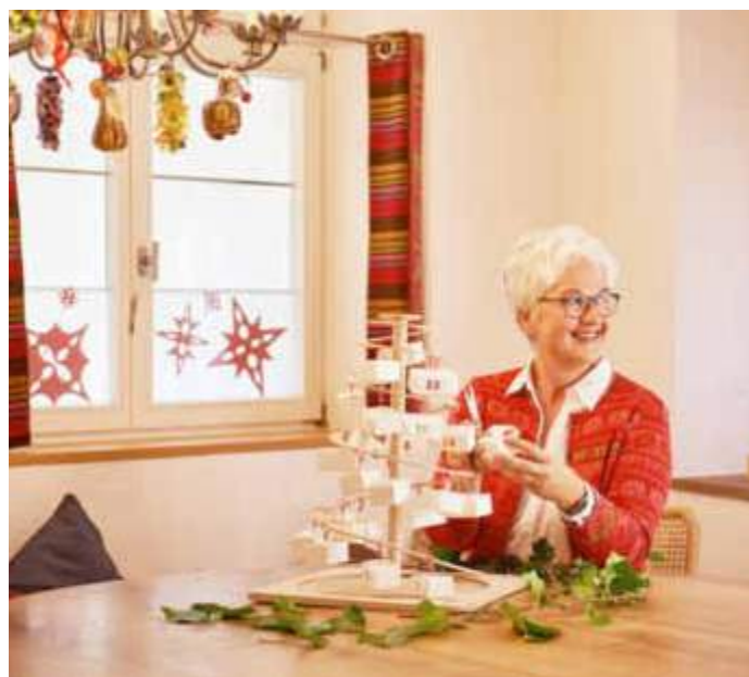
Der kleine Spiralbaum kann jedes Jahr wieder als Adventskalender geschmückt werden.

(djd). In der Adventszeit wird in den meisten Familien gebastelt und weihnachtlich dekoriert. Viele Kinder wünschen sich einen Adventskalender, der die Wartezeit bis Heiligabend verkürzt. Mamas, Omas oder Tanten, die keinen Schokoladenkalender verschenken möchten, müssen selbst kreativ werden. Die Frage ist nur: wie? Für alle, die wenig Zeit für komplizierte Basteleien haben, könnte der Tischspiralbaum der Designmanufaktur Oskar eine mögliche Antwort sein. Mit einer Höhe von etwa 50 Zentimetern lässt er sich auf einem Tisch oder Sideboard platzieren. Unter www.oskar-design sind einige Dekorationsvorschläge zu finden. An den Spiralen können kleine Tüten oder Päckchen einfach festgebunden werden. Weihnachtliche Geschenkbänder sorgen für einen festlichen Look.