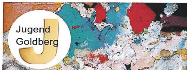
Jugendclub, Parkstrasse 14, 19399 Goldberg / Jugendclub Mestlin, Marx-Engels-Platz 5, 19374

Fritz-Reuter-Apotheke 19370 Parchim, Blutstr. 14 ..... 03871 226297 www.fritzreuterapotheke.de