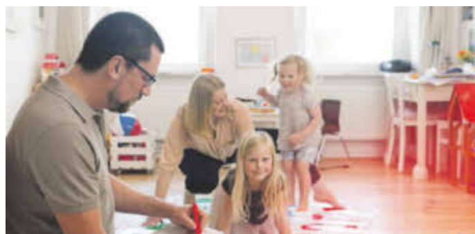
Neue Lebenssituationen sind mit besonderen Herausforderungen verbunden, auch in finanzieller Hinsicht.

(djd). Leben bedeutet Veränderung. Familiengründung, Hausbau, ein Jobwechsel oder auch länger andauernde Kurzarbeit können den Alltag gründlich auf den Kopf stellen. Gerade wenn es stressig ist, geraten die privaten Finanzen schnell aus dem Blick. Früher oder später aber muss das finanzielle Grundgerüst von der Miete über den Autokredit bis zur Haftpflicht wieder auf die neue Lebensphase angepasst werden. Ein Finanzcheck ist bequem vom Sofa aus möglich. Unter www.budgetanalyse.de kann jeder anonym und kostenfrei eine Online-Analyse der eigenen Finanzen erstellen. Damit lassen sich nicht nur weitere Lebensentscheidungen vorbereiten, sondern auch Lücken in der Vorsorge entdecken. Außerdem ist ein Ausgabenvergleich mit anderen Haushalten in ganz Deutschland möglich.