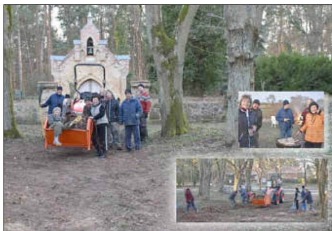
Team Dobbin im Einsatz