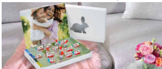
In einer individuellen Verpackung mit einem Schnappschuss der Lieben schmeckt die Osterüberraschung noch mal so gut.

(djd). Wiederkehrende Geschenkkanlässe gibt es zu Genüge, doch die zündende Geschenkidee lässt oft auf sich warten. Dabei bestehen besondere Präsente vor allem durch ihre individuelle Note. Für den persönlichen Touch sorgen vor allem Erinnerungen an gemeinsame Momente, die als Fotos auf jedem Smartphone schlummern. Kinderleicht lassen sich diese Schnappschüsse mit etwas Kreativität zu liebevollen Geschenken verwandeln. Zahlreiche Ideen und Anregungen dazu gibt es etwa unter www.pixum.de . Egal ob zu Ostern, am Muttertag, zu Pfingsten oder einfach so zwischendurch: Kreative Fotogeschenke helfen zudem, die aktuelle Distanz zu den Lieben zu überbrücken. So kann man seinen Liebsten, auch aus der Ferne, ganz nah sein.