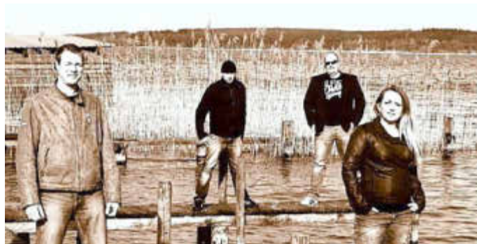
Recover-Live Band zu Gast in Sandhof