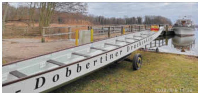
Taufe des 2. Bootes der Drachenköpp