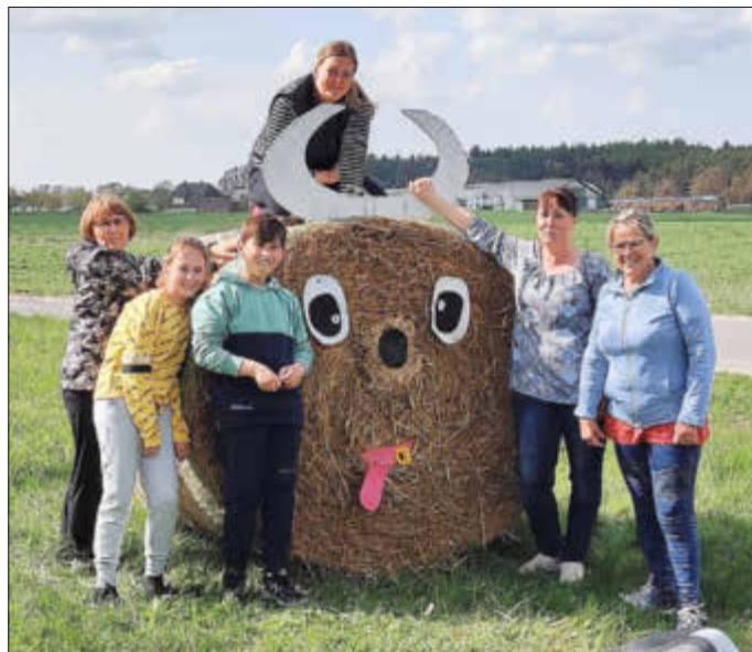
Fleißige Helfer beim Aufbau der Strohfiguren in Below

Die in fröhlichen Farben leuchtenden Strohfiguren lassen es schon von weitem erkennen: Bald ist es wieder soweit, am Samstag nach Himmelfahrt ist in Below Lindenfest. Die Belower Dorfgemeinschaft, die Gemeinde Techentin, die Kirchengemeinde Techentin-Mestlin-Kladrum und der Heimatverein der Gemeinde Techentin „Kiek in't Land“ e. V. bereiten zurzeit mit viel Freude und Elan das traditionelle Fest rund um die Belower Kirche vor. Nach dem Eröffnungsgottesdienst, der um 11:00 Uhr beginnt, erwartet die Gäste ein buntes Programm mit Musik, Unterhaltung und sportlichen Wettkämpfen für Groß und Klein bei sicherlich viel Spaß und Spiel. Für das leibliche Wohl aller Gäste sorgen ab 12:00 Uhr diverse Stände mit leckeren Angeboten. Die kleinen Gäste erwartet ein buntes Kinderprogramm. Auch ein Flohmarkt und eine Tombola mit vielen schönen Preisen warten auf die Gäste. Zum Abschluss gibt es etwas für die Sinne - ein Konzert ab 17:00 Uhr in der Kirche. Abends ist Tanz in der Gaststätte in Below. Seien Sie herzlich eingeladen!