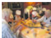
Bewohner so betreuen, wie man es selbst gern hätte