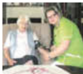
In guten Händen

BETREUTE WOHN- GEMEINSCHAFT im SENIORENLANDSITZ