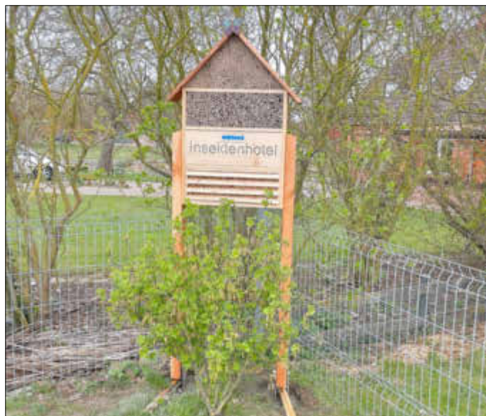
Insektenhotel gesponsert von der WEMAG

Nach Ostern hatte die WEMAG auch noch eine tolle Überraschung für uns. Sie schenkten uns ein großes Insektenhotel, das auf unserem Spielplatz einen schönen Platz gefunden hat. Die Kinder konnten schon den Einzug der Bienen beobachten. Auf diesem Wege möchten wir uns noch einmal bei der WEMAG bedanken, die immer an die Kinder in unserer Kita denken, nicht nur zum Osterfest.