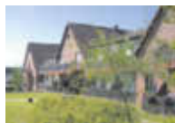
Rundum gut versorgt

BETREUTE WOHN- GEMEINSCHAFT im SENIORENLANDSITZ