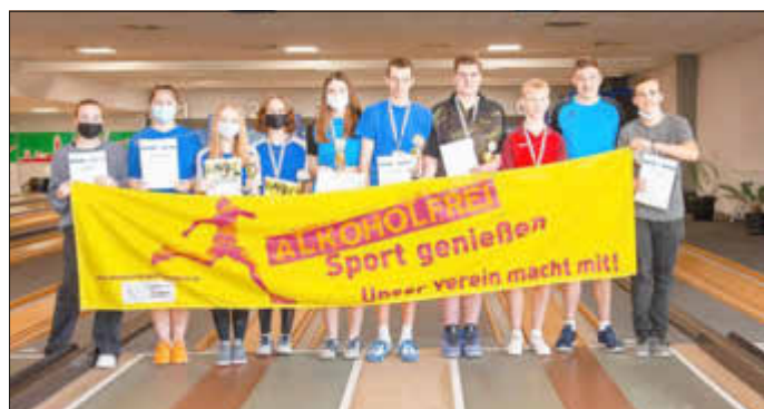
Die jungen Kegler gaben ein Statement gegen den Drogenkonsum im Sport ab.