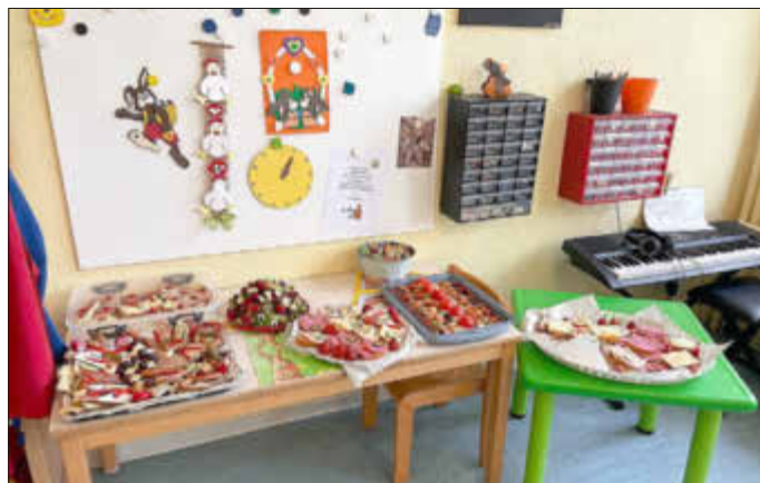
Osterbrunch in der Kita