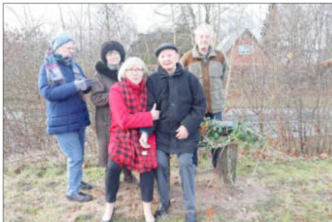
Die neue Ruhebänk zwischen Goldberg und Dobbertin wird gut angenommen.