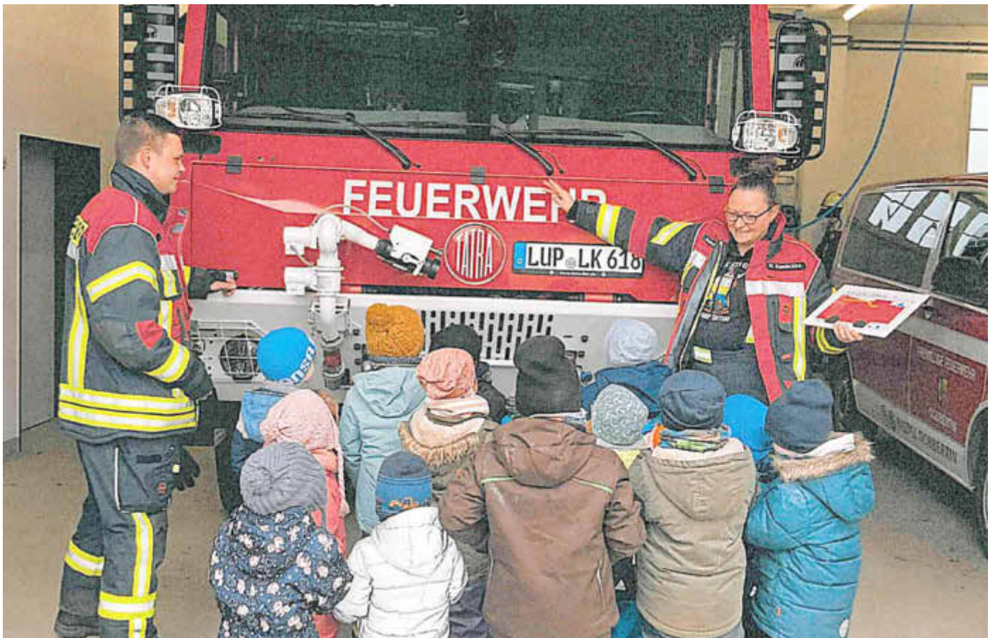
Die Kinder bestaunen das Feuerwehrauto.