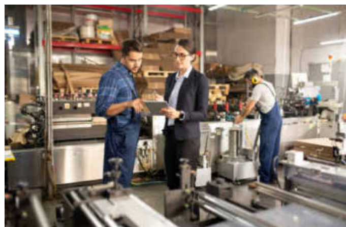
Immer mehr Firmen spüren die Auswirkungen des Fachkräftemangels. Eine Studie weist auf eine immer beliebtere Möglichkeit hin, um Fachleute zu binden: Indem der Arbeitgeber seinen Beschäftigten eine von ihm finanzierte betriebliche Krankenversicherung (bKV) anbietet.

(djd). Die weit überwiegende Mehrheit der Unternehmen in Deutschland hat zunehmend mit Fachkräftemangel zu kämpfen. Aktuell kann mehr als die Hälfte der Firmen offene Stellen nicht mehr besetzen. Wie lassen sich gut ausgebildete und motivierte Leute gewinnen und langfristig halten? Eine infas-quo-Studie weist auf eine immer beliebtere Möglichkeit hin: Arbeitgeber finanzieren ihren Beschäftigten eine betriebliche Krankenversicherung (bKV) und bieten ihnen so zusätzliche Gesundheitsleistungen. Eine bKV zahlt laut Umfrage auf die Zufriedenheit der Mitarbeitenden ein. In Unternehmen, die eine solche Versicherung anbieten, fühlen sich rund drei Viertel der Angestellten von ihrem Arbeitgeber wertgeschätzt, in Firmen ohne bKV nur 50 %. Mehr Infos gibt es beispielsweise unter www.allianz.de/bkv .