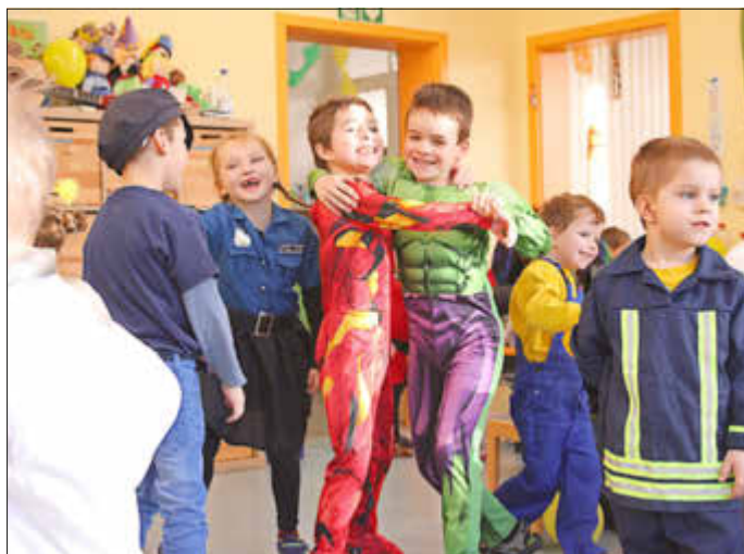
Kleine „Helden“ tanzen glücklich in den Faschingstag hinein.