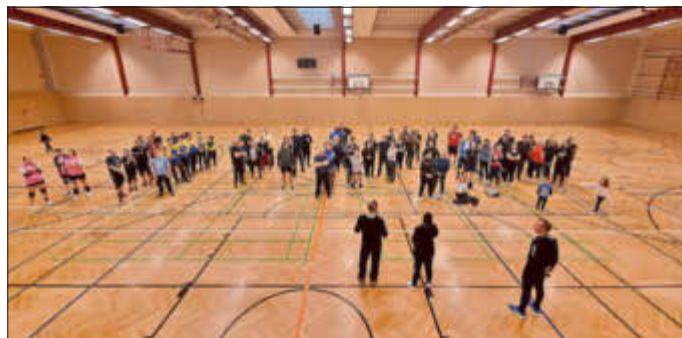
Rege Beteiligung am Turnier