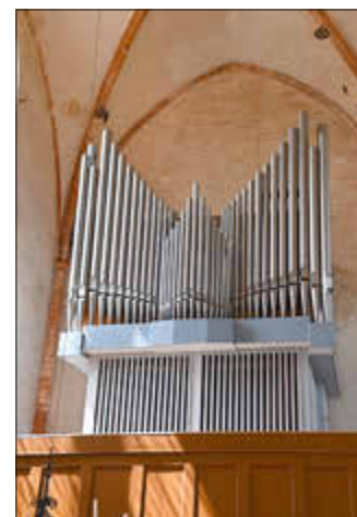
Orgel in der Kirche Mestlin

Musik berührt uns auf eine besondere Weise. Mit einem fröhlichen Lied auf den Lippen lässt sich manches leichter erledigen; bei schwungvoller Musik aus dem Radio geht die Arbeit schneller von der Hand. Das Evangelische Gesangbuch enthält viele Lieder: ältere Melodien mit vertrauten Texten, neuere Kompositionen mit moderneren Worten, fröhliche Danklieder und auch getragene Lieder für traurige Anlässe. So gibt es eine ganze Bandbreite für die verschiedensten Anlässe und Stationen in unserem Leben.