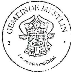
Uwe Schultze Bürgermeister

„Soweit beim Erlass dieser Satzung gegen Verfahrens- und Formfehler verstoßen wurde, können diese nach § 5 Abs. 5 der Kommunalverfassung Mecklenburg-Vorpommern vom 08.06. 2004 (GVObI. M-V 2004 S. 205) nur innerhalb eines Jahres geltend gemacht werden. Diese Einschränkung gilt nicht für die Verletzung von Anzeige-, Genehmigungs- und Bekanntmachungsvorschriften.“