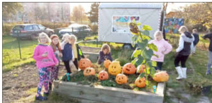
Kids mit ihren Werken im Jugendgarten

Kaum wurden die zehn Kürbisse für das Gestalten vorbereitet, schon hatten die Kleinsten sich mit speziellem Werkzeug ausgerüstet und warteten auf den Start. In Zusammenarbeit zweier Kinder, wurde jeweils ein fantasievoller Kürbis gestaltet, der für alle Besucher des Gartenvereins Krückenbreite gut zu erkennen ist. Bei strahlendem und sonnigem Wetter um die 20 Grad Celsius, war es ein gelungener Projekttag, der von 13:30 - 16:00 Uhr angeboten wurde. In Mestlin wurde die Kultur- und Insektenwiese auf dem Parkplatz vorm Kulturhaus mit mehreren „Ghost Rider“= Halloweenkürbisse gestaltet. Auch hier wurden an einem Nachmittag im Vereinsheim des SV Mestlin in einer kreativen Runde Kürbisse verschönert. Jeder werkelt und kreiert Fratzen so gut er konnte nach seinen altersentsprechenden Fähigkeiten.