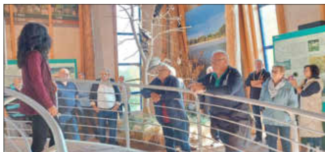
Ein Besuch im Karower Meiler wurde zum Erlebnis.