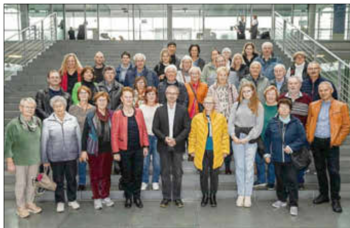
Dobbertiner unterwegs in Berlin