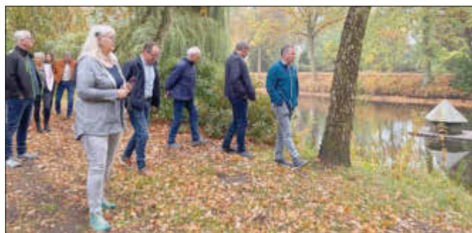
Besichtigung der Neu Poseriner Parkanlage.