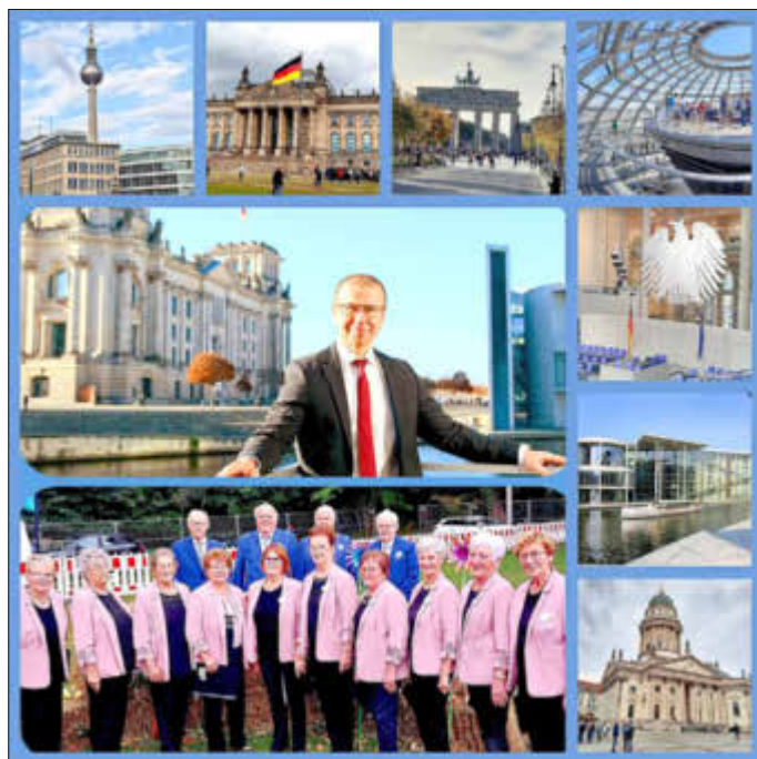
Impressionen aus Berlin