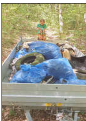
Berge voll mit Müll liegen in unseren Wäldern rum.

Es ist traurig, dass ausgerechnet immer diejenigen den Müll sammeln, die ihn nicht verursacht haben. Umso mehr freuen wir uns über dieses Engagement und bedanken uns im Namen des Forstamtes Sandhof bei den fleißigen Helfern herzlich.