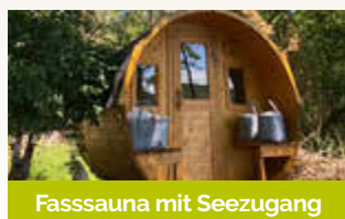
Fasssauna mit Seezugang

Jeden Freitag im Juli & August ab 18 Uhr Grillbuffet inkl. Vorspeisen und Desserts p. P. € 32,90 (Kinder 4-12J. 50%)