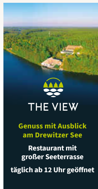
Van der Valk Freizeit und Touristik GmbH - Krakower Chaussee 1 - 18292 Linstow