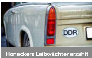
Honeckers Leibwächter erzählt

06.10. | 20.10. | 03.11. um 18 Uhr ab 18 Uhr mit italienischen Spezialitäten inkl. Begrüßungsgetränk und Limoncello p. P. € 32,90