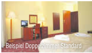
Beispiel Doppelzimmer Standard