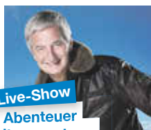
Live-Show Abenteuer Weltumrundung