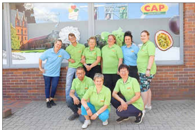
Das Team vom Cap-Markt Dobbertin begrüßt seine Gäste immer mit einem Lächeln.