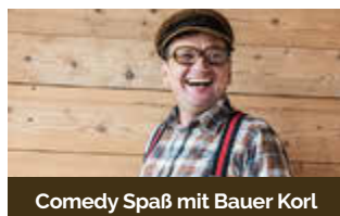
Comedy Spaß mit Bauer Korl

04.11. um 17:30 Uhr 05.11. um 14 Uhr DDR-Geschichten und Lesung mit Honeckers Leibwächter