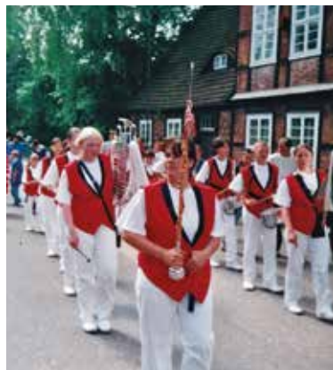
Der Spielmannszug beim Festumzug 1998