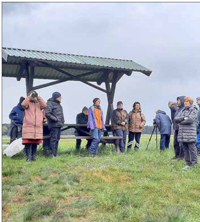
Treffen von Naturfreunden am Aussichtspunkt in der Dobbiner Plage.

Im April trafen sich einige Naturfreunde in Dobbin, um sich die derzeit überflutete Dobbiner Plage anzuschauen, die verschiedenen Vogelarten, die sich hier angesiedelt haben und dem Vortrag von Katja Hahne über die Pardieskoppel zu folgen. Im Anschluss packten alle tatkräftig mit an und zogen in der Paradieskoppel, die von Schafen beweidet wird, einen Zaun um das „Große Zweiblatt“ (eine seltene Orchideenart) zu erhalten.