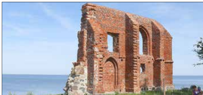
Blick auf die Ruine der Kirche von Hoff (Trzęsacz) an der pommerschen Ostseeküste.

Der Historiker Dr. Fred Ruchhöft lädt herzlich ins Natur-Museum Goldberg ein und nimmt seine Gäste mit auf eine spannende Reise in das polnische Hinterpommern: „ Pommern – Das Land am Meer. “ Für echte Mecklenburger mag es fast wie eine Auslandsreise klingen – in unser östlich benachbartes Vorpommern. Hinter der Oder beginnt das historische Hinterpommern, das heute als Woiwodschaft Westpommern zu Polen gehört. Dr. Fred Ruchhöft berichtet von seinen Erkundungen durch dieses reizvolle Land, das mit seiner Geschichte, den gastfreundlichen Menschen und liebevoll gepflegten Städten und Dörfern beeindruckt. Bekannt sind die schönen Ostseestrände von Swinemünde bis Kolberg ebenso wie die pommersche Seenplatte mit ihren kleinen Orten und stillen Landschaften. Auf der Reise begegnen wir alten Hansestädten wie der Herzogsstadt Stettin und Kolberg, auch viel weniger bekannten, doch ebenso sehenswerten Orten. Der „Kaffee-Klatsch“ findet am 28. Februar 2026 um 14:30 Uhr im Natur-Museum Goldberg statt. Der Eintritt kostet 7,- €, inkl. Kaffee und Kuchen. Um Voranmeldungen unter 038736-40443 wird gebeten.