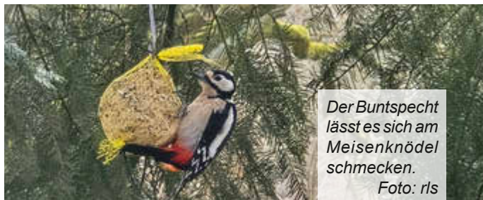
Der Buntspecht lässt es sich am Meisenknödel schmecken.

Dienstag 09:00 Uhr bis 12:00 Uhr Donnerstag 09:00 Uhr bis 12:00 Uhr und 13:00 Uhr bis 17:30 Uhr