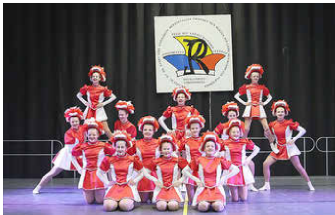
Die Funkengarde erzielte im Schautanz einen tollen 4. Platz.