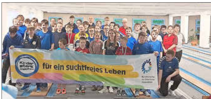
Ein Großteil der Teilnehmer in der AK 10 und AK14 und deren Trainer sind für die DOSB-Initiative „Kinder stark machen“.