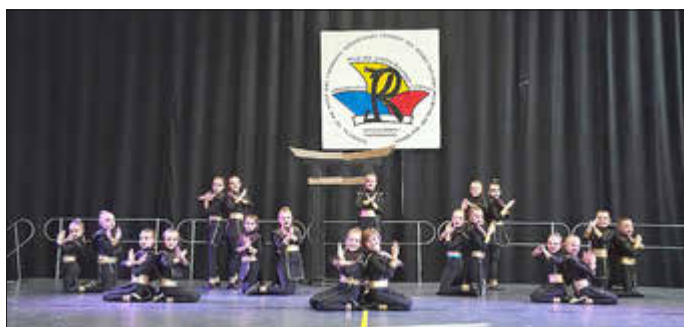
Im Gardetanz erreichte die Minigarde einen hervorragenden 3. Platz und stand beim Schautanz ganz oben auf dem Siegereppchen.